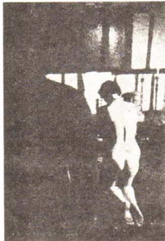
Cerimônia de Iniciação de Feiticeira